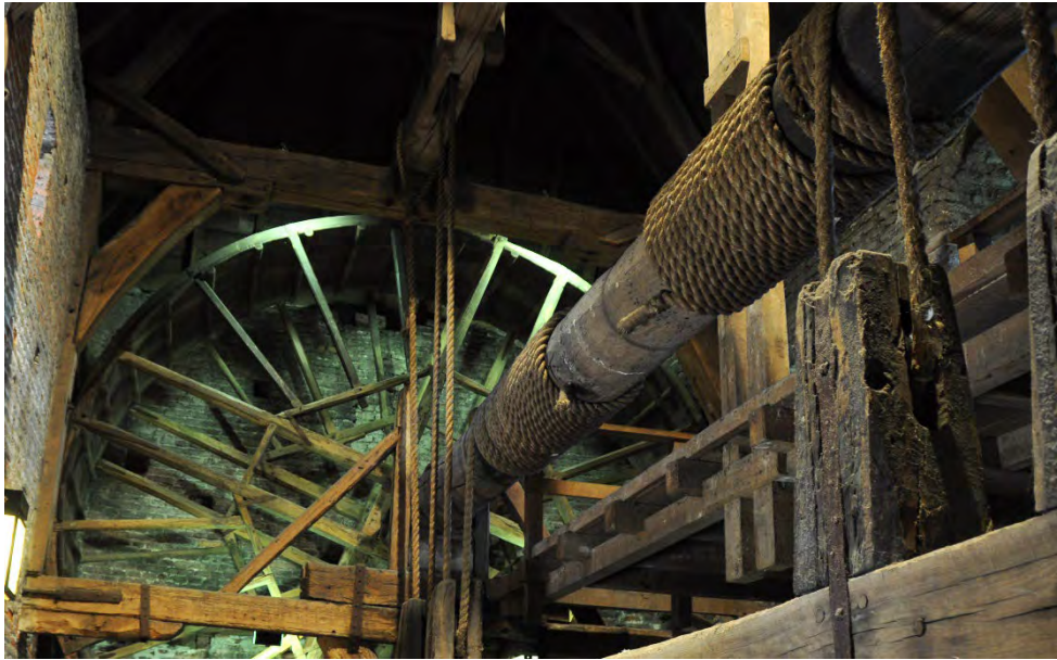
Raddraaier - Tredmolen met hijsas aan de binnenkant van de Koppelpoort in Amersfoort.

Wie in de openbare ruimte de boel op stelten zet of bijvoorbeeld een rel ontketent, wordt wel eens een raddraaier genoemd. Waar komt dit woord eigenlijk vandaan?