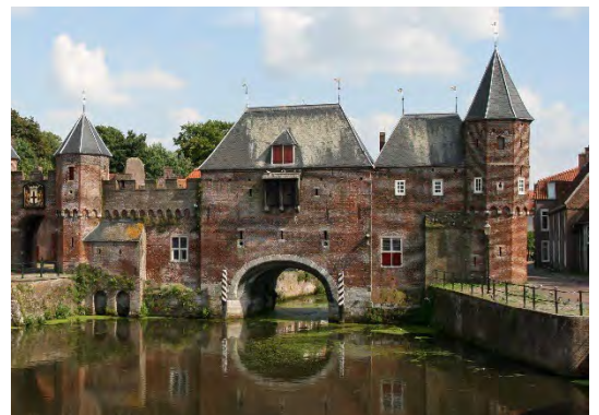
De Koppelpoort in Amersfoort

Dan is er tot slot nog een aardig verhaal over de Koppelpoort in Amersfoort die een logische verklaring biedt voor het woord. Deze stadspoort moest elke dag geopend en gesloten worden. Voor deze zware en gevaarlijke klus zouden zogenaamde ‘raddraaiers’ zijn ingeschakeld. Het ging dan doorgaans om veroordeelde misdadigers. Per keer moesten twaalf mannen de poort openen door gelijktijdig in een rad (tredmolen) te lopen. Hiermee zetten ze het schot voor de poort in beweging, maar dat was dus niet zonder gevaar. Het was bijvoorbeeld belangrijk dat men precies tegelijk begon en even snel liep. Wie het ritme niet volgde, liep het risico te vallen om vervolgens enkele botten te breken.