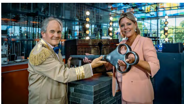
Beeld & Geluid-directeur Eppo van Nispen tot Sevenaer opent de Schatkamer met minister Rianne Letschert van OCW.

Heel Nederland kan vanaf nu kosteloos terugkijken en terugluisteren in een van de grootste media-archieven ter wereld. Het Nederlands Instituut voor Beeld en Geluid (afgekort Beeld & Geluid) heeft de zogeheten Schatkamer gelanceerd: een online platform met meer dan 700.000 radio- en televisieprogramma's, unieke opnames en historische films.