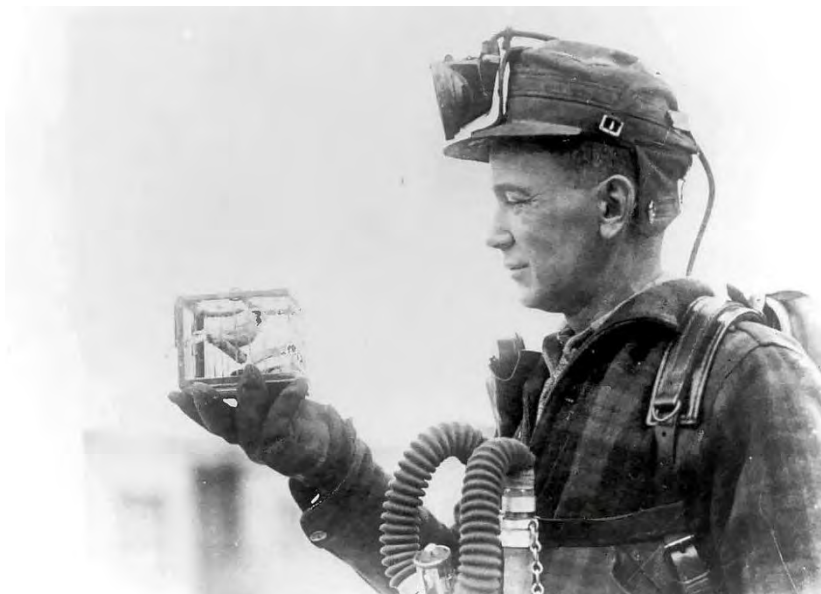
Een mijnwerker met een kanarie in een kooitje, gebruikt om koolmonoxidegas mee op te sporen, 1928

Na verloop van tijd werd de kanarie in de kolenmijn een ‘gevleugelde’ uitdrukking met als betekenis (indicatie voor) ‘gevaar’ of ‘alarm’. Ook in het Engels is de uitdrukking bekend: the canary in the coal mine . De bekende Engelse rockband The Police bracht in 1980 zelfs een nummer uit met die titel.