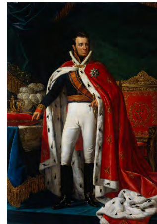
Portret van Willem I koning der Nederlanden.

Tussen de woorden werden sterretjes geplaatst. De keus voor een randschrift heeft ook een praktische aanleiding. Tegenover koning Willem I verklaarde Cornelis Charles Six van Oterleek, de eerste minister van Financiën van ons koninkrijk, dat voor het randschrift was gekozen om... "...het sieraad der stukken te bevorderen en het het besnoeyen moeylijker te maken."