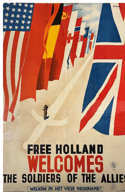
Affiche uit 1945

Door deelname van het Regionaal Historisch Centrum (RHCE) aan dit netwerk worden ook de Eindhovense en regionale verhalen onderdeel van deze landelijke context. De bronnen blijven fysiek op locatie in Eindhoven beheerd, maar worden via Oorlogsbronnen gekoppeld aan andere collecties, waardoor nieuwe verbanden en inzichten kunnen ontstaan.