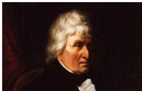
Schilderij Pieter Vreede.