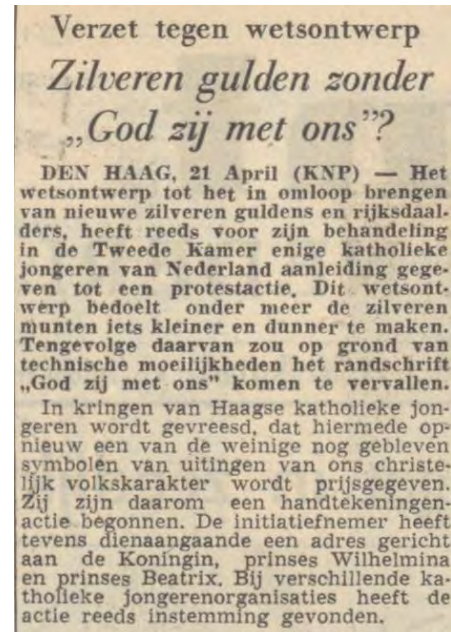
Gulden zonder “God zij met ons”? De Volkskrant, 23-04-1953.