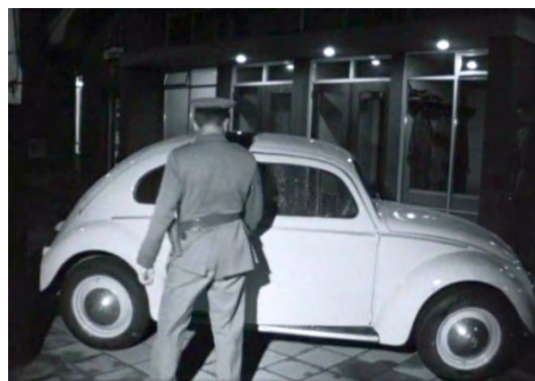
Over Reusel vinden we onder meer een NTS-Journaal van 23 augustus 1966 met een item over Botersmokkel bij Reusel.

Het aanbod in de Schatkamer groeit continu. Nieuwe titels worden toegevoegd via onder meer de zogenoemde 'out of commerce'-regeling en via afspraken met rechthebbenden. Het archief bestrijkt de periode 1920 tot 2020. Downloaden is niet toegestaan; alles is alleen te bekijken of te beluisteren in de browser.