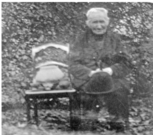
Panken in 1903 zittend naast een stoel met urnen.

dorpsgeschiedenissen van het Kempenland, archeologie, volkskunde en autobiografisch werk. Enkele studies werden gepubliceerd zoals Beschrijving van Bergeik en Volksgebruiken en gewoonten in Noord-Brabant . Peer Meurkens, die zich al langer met Panken bezig houdt, baseerde zich op zijn zes thematische inleidingen bij De dagboeken van P. N. Panken 1819-1904. Memorieboek van een Brabantse schoolmeester [I t/m VI] en nog wat van zijn studies en artikelen, om honderd jaar na de sterfdag van Panken het oude Kempenland van 1820 tot 1900 in beeld te brengen. Hoe nam Panken zijn omgeving waar en hoe ontwikkelde zijn samenleving zich: De wereld van.... De dorpen waar Panken heeft gewoond, waren zijn geboorteplaats Duizel, Westerhoven waar hij het beroep van dorpsonderwijzer uitoefende en Bergeijk waar hij opgroeide en op latere leeftijd terugkeerde.