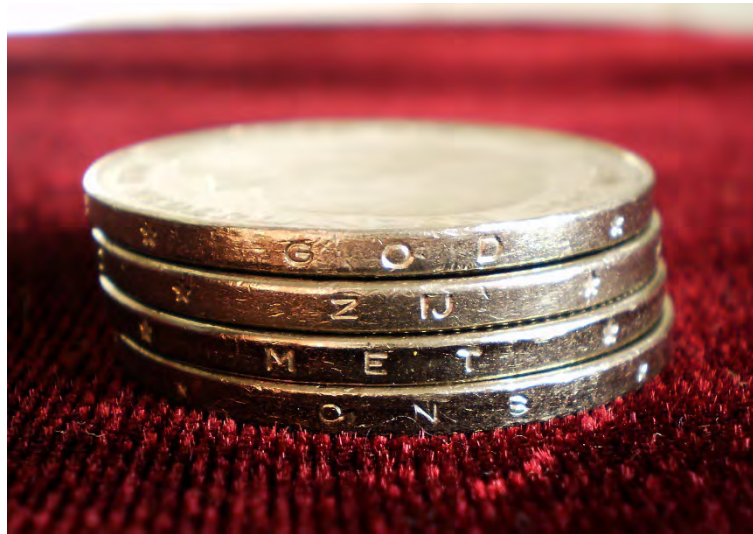
Het randschrift "God zij met ons" op een stapel rijksdaalders

Op de Nederlandse versie van de munten van twee euro is de randspreuk "God zij met Ons" te lezen. Ook in het guldentijdperk was deze spreuk op verschillende munten te lezen. Waarom eigenlijk?