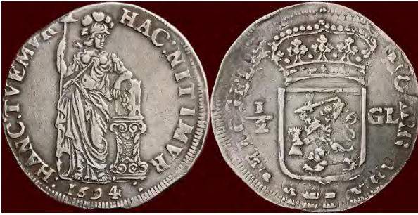
Zilveren muntstuk uit 1694 ter waarde van een halve gulden.