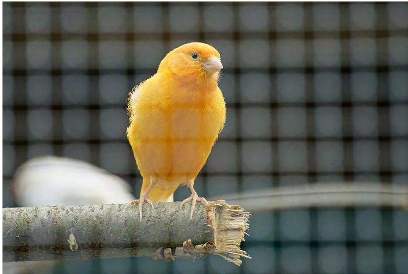
Kanarie in een kooi

De uitdrukking “dat is een kanarie in de kolenmijn” wordt vooral gebruikt als aanduiding voor een vroegtijdig alarmsignaal dat waarschuwt voor groot gevaar. De zegswijze gaat terug op de tijd dat mijnwerkers letterlijk een kanarie in een kooitje meenamen als ze zich ondergronds begaven. De kleine vogeltjes zijn veel gevoeliger voor giftige gassen dan mensen. Stierf het vogeltje dan kon dat er dus op wijzen dat er zich ergens een lek bevond.