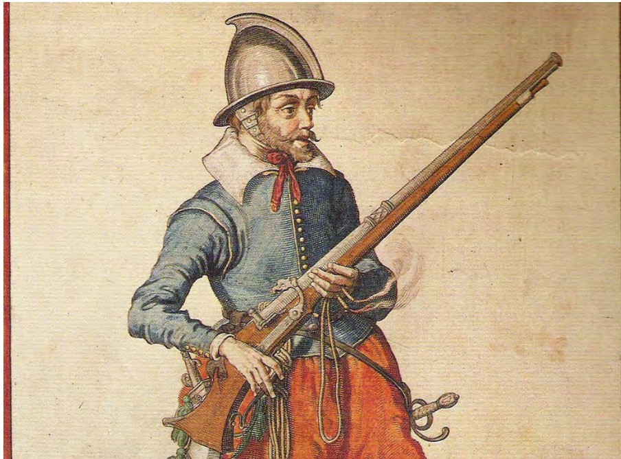
Musketier met een musket - Jacob van Gheyn, 1608.

Een musketier is kort gezegd een soldaat die met het musket bewapend is. Dit handvuurwapen was met name populair in de zestiende en zeventiende eeuw. De musket was de opvolger van de haakbus en een voorloper van het geweer. Meestal was hij voorzien van een lontslot. De schootsafstand bedroeg circa tweehonderdvijftig meter.