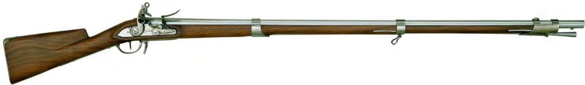
Snaphaan model 'Charleville modèle 1766'.

opgesteld. De handelingen die de musketiers moesten uitvoeren werden vervolgens in een vast patroon gebracht. Na het gelijktijdig afvuren van een schot door de voorste linie, liepen de musketiers naar de achterste rij om opnieuw te laden. De tweede rij stapte ondertussen naar voren om ook een schot te lossen. Zij waren inmiddels voorbereid en hoefden alleen nog maar het furket te plaatsen, te richten en te schieten. Deze musketiers sloten vervolgens achter aan in de rij en begonnen ook aan het herladen van de musketten, waarop de derde rij naar voren liep om een schot te lossen. Enzovoort.