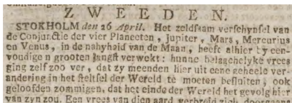
Amsterdamse Courant 14-05-1774