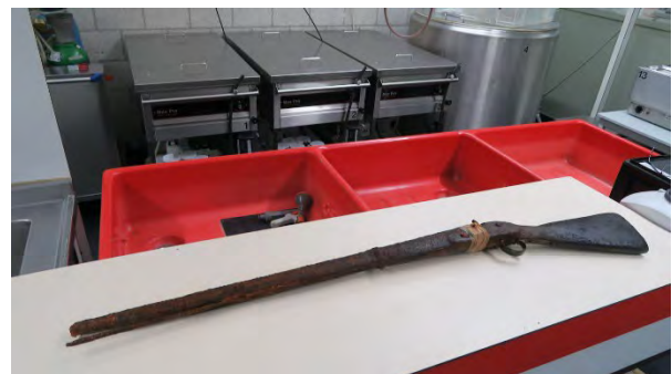
De voorlader wacht in atelier Restaura een langdurig conserveringsproces.

Voorladers zijn ruwweg tussen 1450 en 1850 in gebruik geweest. Het is bekend dat dit type wapen vanaf 1842 tot ca. 1850 behoorde tot de uitrusting van de soldaten van het Nederlandse leger. Dat betekent dat dit geweer uit de Reusel zeer waarschijnlijk zo'n 175 jaar oud zal zijn.