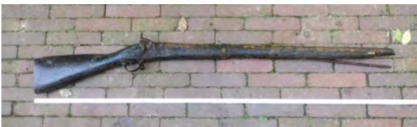
De oude voorlader vóór de restauratie.

In het najaar van 2022 werd tijdens graafwerkzaamheden bij de brug over de Reusel aan de Broekkant in Lage Mierde een oud geweer, een zogenaamde voorlader gevonden.