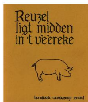
De Canon van Reusel

Veel dorpen en steden beschikken inmiddels over een canon. Een canon is een overzicht met teksten en beelden in chronologische volgorde waarmee de belangrijkste gebeurtenissen van een dorp, stad of land worden weergegeven. Reusel met zijn rijke historie kan daar natuurlijk niet bij achterblijven. Daarom heeft de Heemkunde Werkgroep Reusel (mede in het kader van een gezamenlijke Kempencanon) het initiatief heeft genomen een canon over Reusel samen te stellen. Hierbij publiceren we de eerste versie van deze canon van Reusel. Het is nu een overzicht van een twintigtal gebeurtenissen die te maken hebben met de geschiedenis van ons dorp; van de ijstijd tot en met de huidige periode.